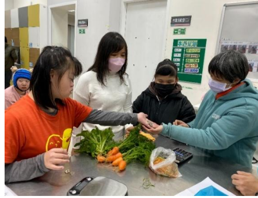
▲ 小農夫市集~練習買菜