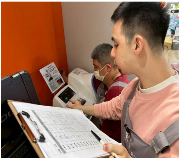
▲ 服務對象自主操作使用血壓計，並且由血壓體重助手協助登記測量數據。