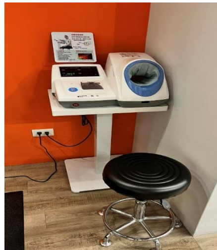
▲ 隧道式全自動血壓計(含桌椅)