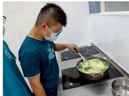
▲ 簡易烹飪-珠蔥蛋花湯