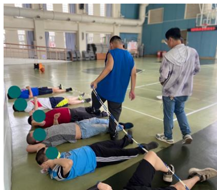
▲ 生活/樂趣化訓練活動介入