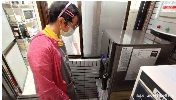
▲ 購置更換飲水機，提供服務對象安全衛生的飲用水