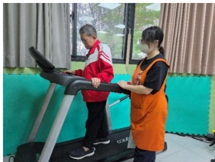
▼新購入跑步機讓服務對象更安全的運動。