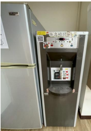
▼ 飲水機修繕安裝前