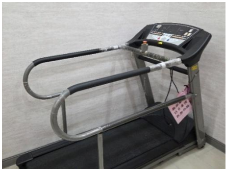
▼汰舊的跑步機，扶手都已經維修多次。