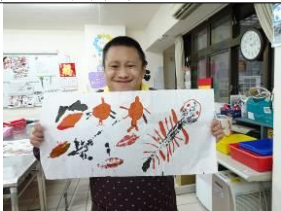
夢想工坊服務對象創作作品