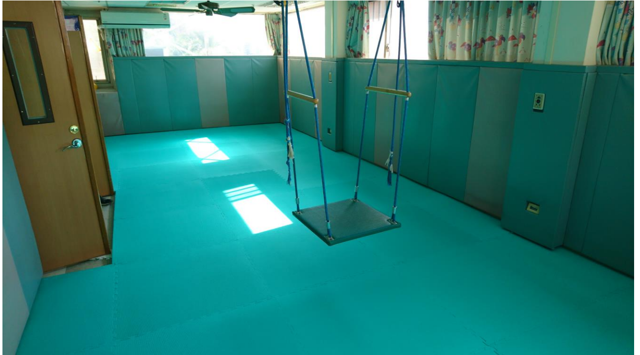
地墊完工後-感覺統合室

(六)心智障礙者自立支持服務-補助身心障礙機構服務對象服務相關同意書等文件易讀版編制計畫業務費及社團訓練業務費，共支出 29,314 元整。