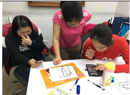
活動小組討論帶領