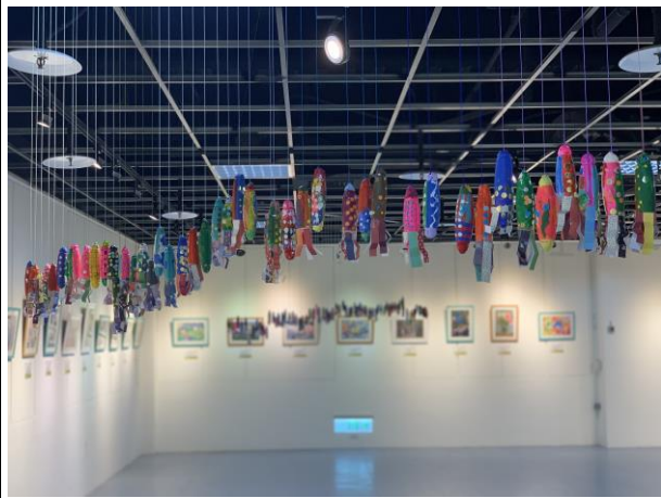
展覽藝術成品佈置