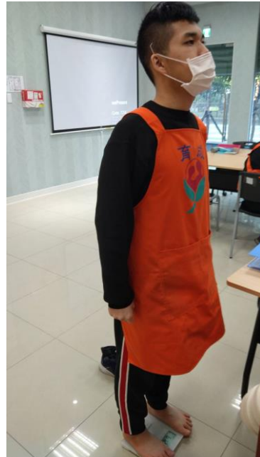
體重機及血壓機：服務對象定期測量體重、心跳及血壓

★淡水義山身心障礙者社區式日間照顧中心(以下稱本中心)為協助居住新北市之身心障礙者走出家庭、參與社區活動，於109年5月4日在新北市淡水區義山里啟動服務，本中心提供兩項服務模式，包含社區式日間照顧服務和作業設施服務，以此落實多元全面性的社區式支持服務。