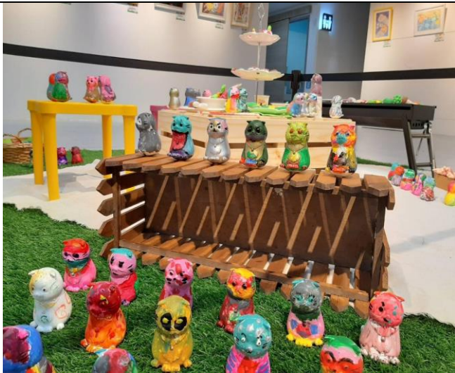
展覽藝術成品佈置