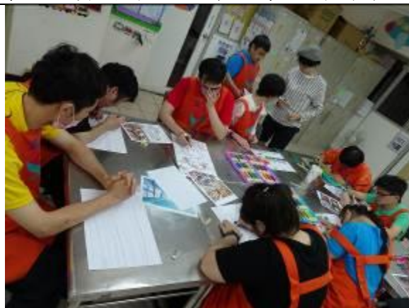
夢想工坊藝術課程老師引導服務對象