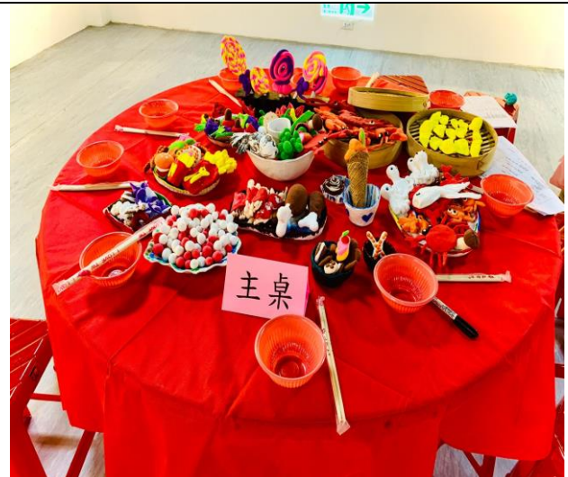
展覽藝術成品佈置

(五)住宿服務-補助本會新北市愛育發展中心地墊更新支出 44,739 元，新購防潑水床墊 20 床支出 37,000 元，合計共支出 81,739 元。