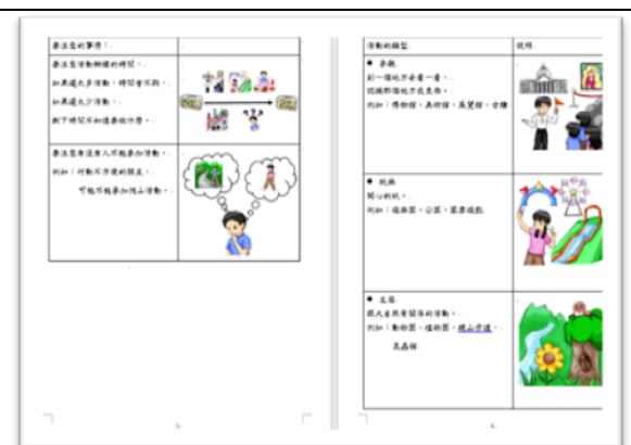
活動規劃手冊易讀版-樣板

(七)職業重建服務-補助本會身心障礙者就業服務中心設施設備購置費用，共支出 16,830 元