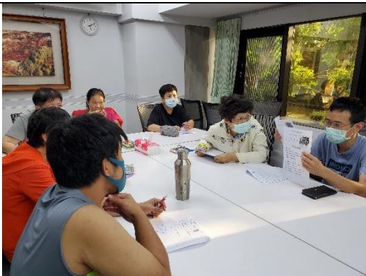
社務小組定期會議