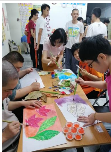
蘭興站藝術課程老師引導服務對象