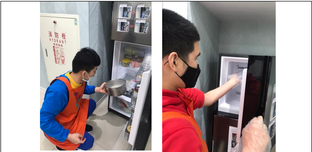
電冰箱：服務對象於居家生活活動練習使用冰箱進行食材的保存