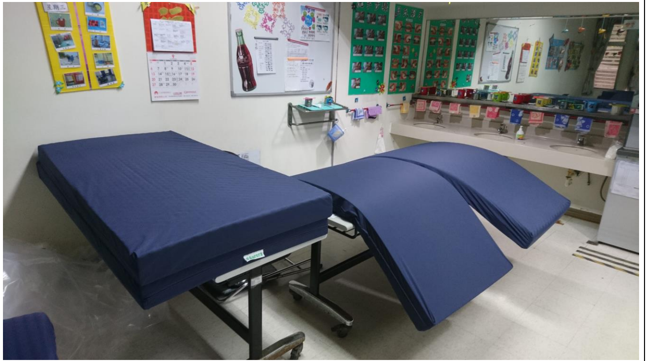
新購置防潑水床墊 20 床