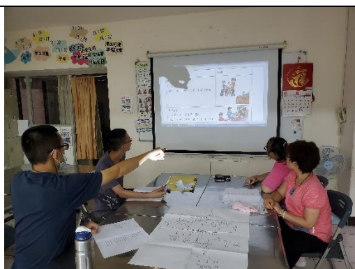
活動規劃手冊編輯小組會議