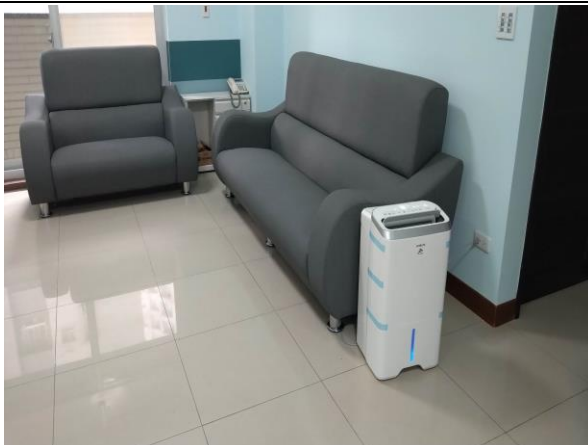
除濕機：維護服務對象健康及家電家具設備耐用。