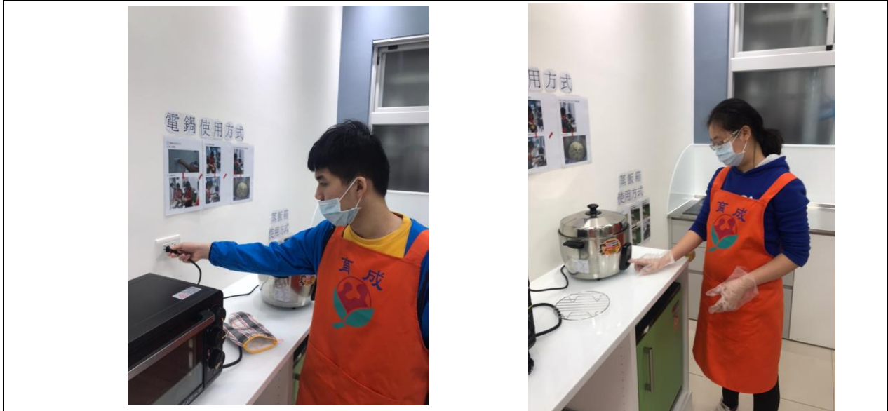
電鍋：服務對象參與居家生活活動練習使用電鍋