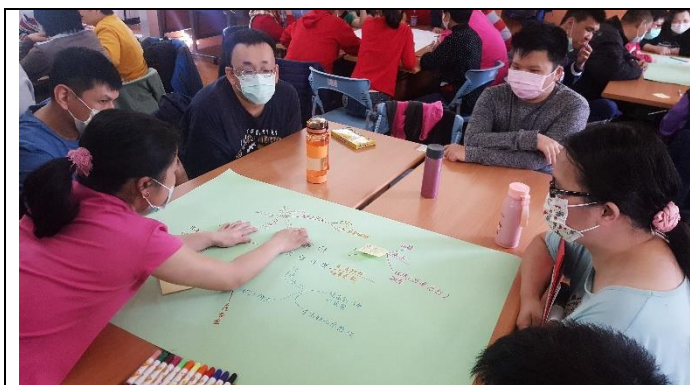
社員大會-帶領討論對社團的期待