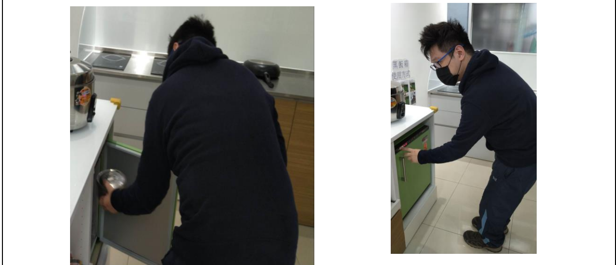
電熱箱：服務對象家中準備便當，自行放置電熱箱加熱