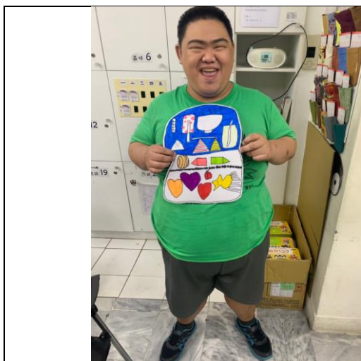
蘭興站服務對象創作作品

績，而在 108 年 9 月 28 日育成舉行得獎作品展覽，除了畫作展覽外更製作其他佈置藝術作品搭配展覽，並結合環保廢棄魚標進行彩繪，展示服務對象多元的藝術細胞，也因藝術創作課程使得服務對象有更多元的生活經驗以及多元休閒活動，也藉由服務對象參與藝術創作課程得到更多成就及自信。