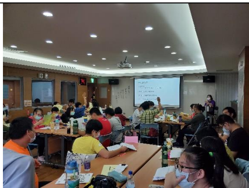
聯合幹部訓練-什麼是 CRPD