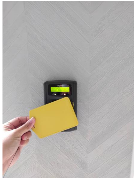
門禁安全設備系統