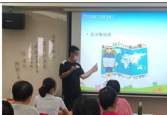
社員大會-報告年度工作