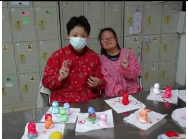
展覽藝術品製作過程