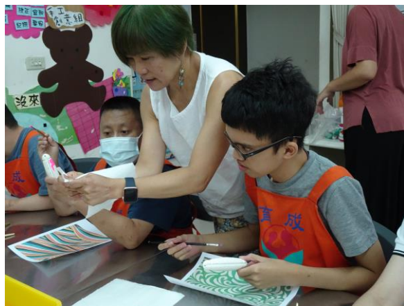
夢想工坊藝術課程老師引導服務對象

(五) 成人訓練服務-補助育成恆德站教保員人事費用，共支出 120,000 元整。