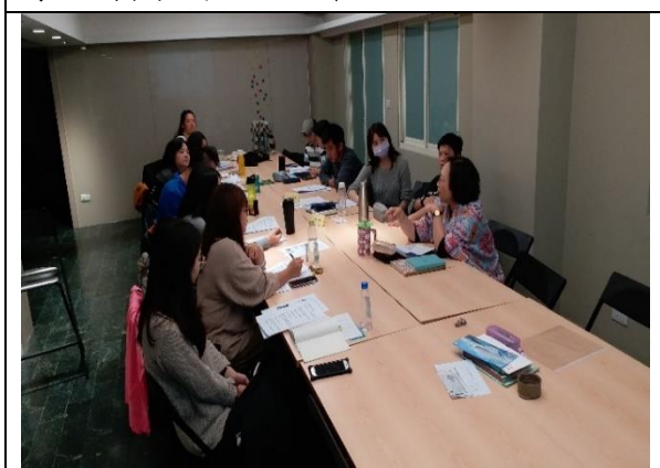
108年11月22日 第二次審查會及工作小組會議