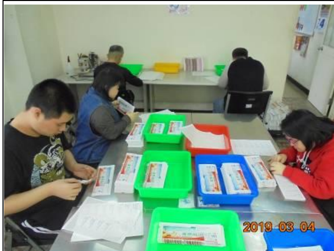
作業活動-蘆州農會會訊貼名條