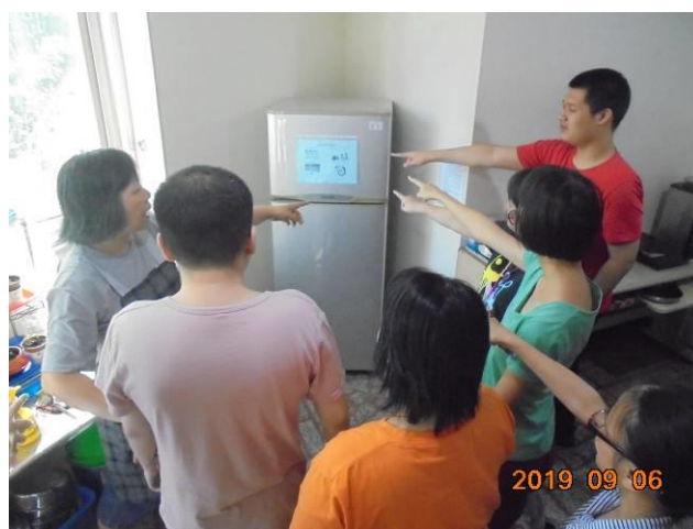
居家生活-冰箱的使用方式