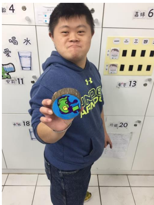
蘭興站服務對象創作作品

於 106 年 1 月開始由本會秘書處連結美術老師於每個禮拜一天半天時間來教導服務對象繪畫，美術老師使用不同素材以及材料組合，引導服務對象畫出多元的畫作，服務對象在參與過程中都展現出新奇的創意與配色，108 年夢想工坊與蘭興站各舉行 33 次及 22 次的藝術創作教學，而在 108 年度育成基金會舉行全國性繪畫比賽中，兩站各有 5 名學員取得不錯的成績，並在巡迴畫展中提供藝術作品作為展覽，也因藝術創作課程使得服務對象有更多元的生活經驗以及多元休閒活動，並藉由參與藝術創作課程得到更多成就及自信。