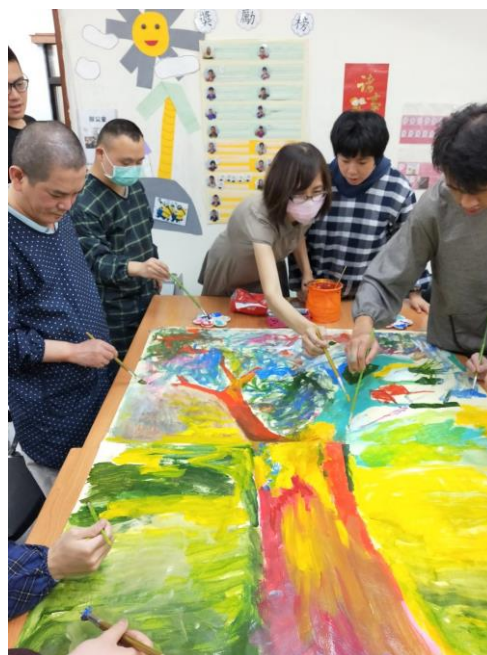
蘭興站藝術課程老師引導服務對象