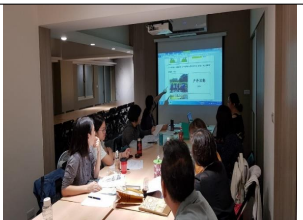
108年8月23日 工作小組會議