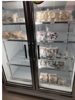
雙門冷藏展示冰箱