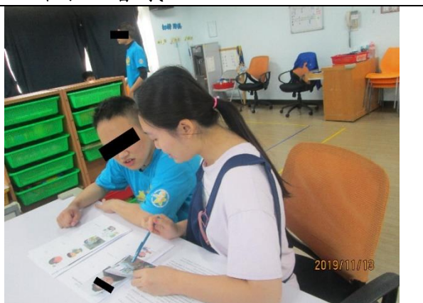
108年11月13日 慈佑發展中心試作