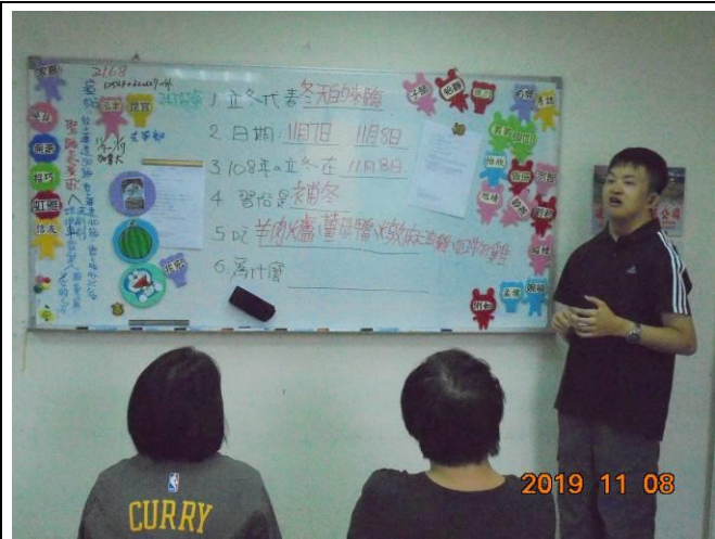
自我倡導-合宜的互動