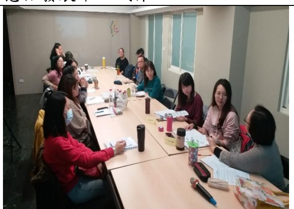
108年11月29日 第三次審查會及工作小組會議