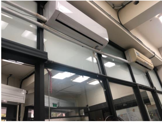
一對二分離式冷氣