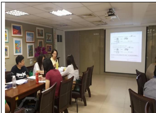
108年7月29日 第一次審查會及工作小組會議