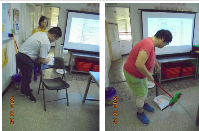
居家生活-環境清潔