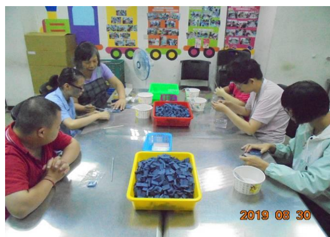
作業活動-電腦絕緣片數數裝袋