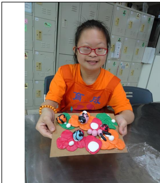
夢想工坊服務對象創作作品