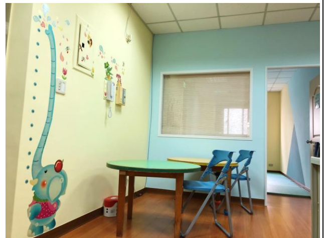
家長或兒童服務等候區