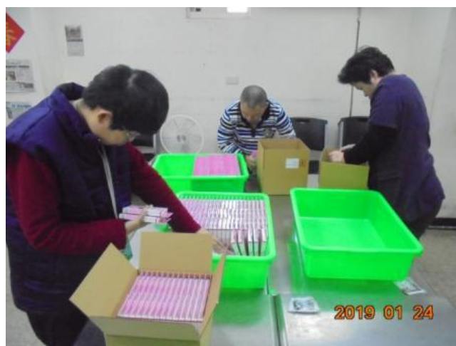
作業活動-痘痘貼成盒裝箱