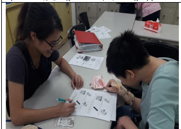
108年10月21日 永明發展中心試作