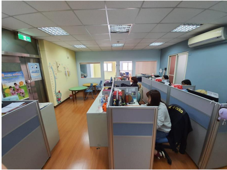
中心辦公空間裝修後